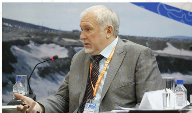
Ехин А.Г. Агентство по недропользованию по Красноярскому краю «Красноярскнедра»