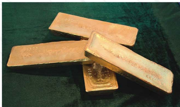
Экскурсия на Красноярский завод цветных металлов имени В.Н.Гулидова. «Красцветмет».