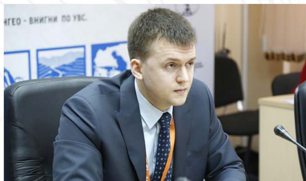
Ехин Д.А. Министерство природных ресурсов и экологии Красноярского края