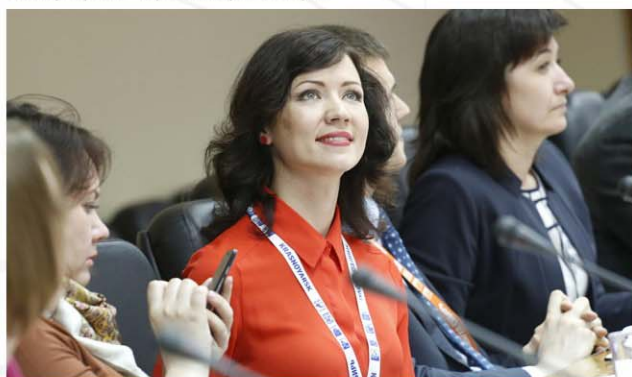
Мироненко Е.Н. Министерство культуры Красноярского края