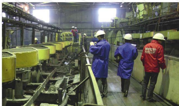
Экскурсия на Горевское Pb-Zn месторождение и Новоангарский обогатительный комбинат.