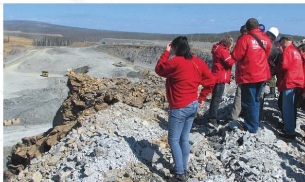
Экскурсия на Олимпиадинское золоторудное месторождение. С посещением месторождений Титимухта и Благодатное.